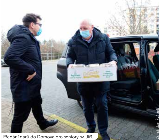
Předání darů do Domova pro seniory sv. Jiří.