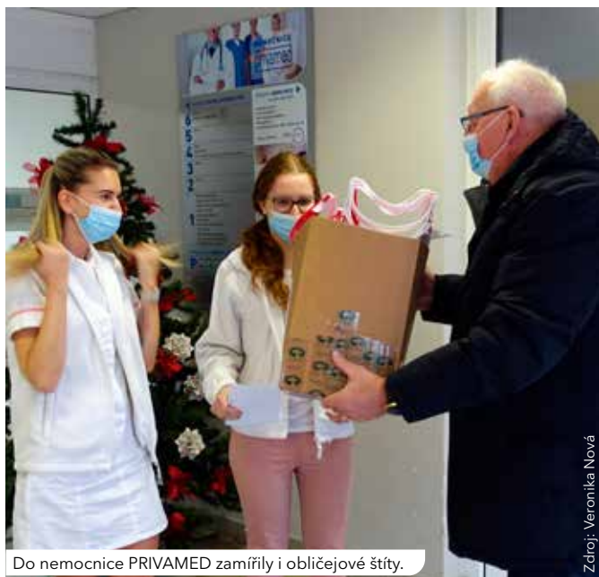
Do nemocnice PRIVAMED zamířily i obličejové štíty.