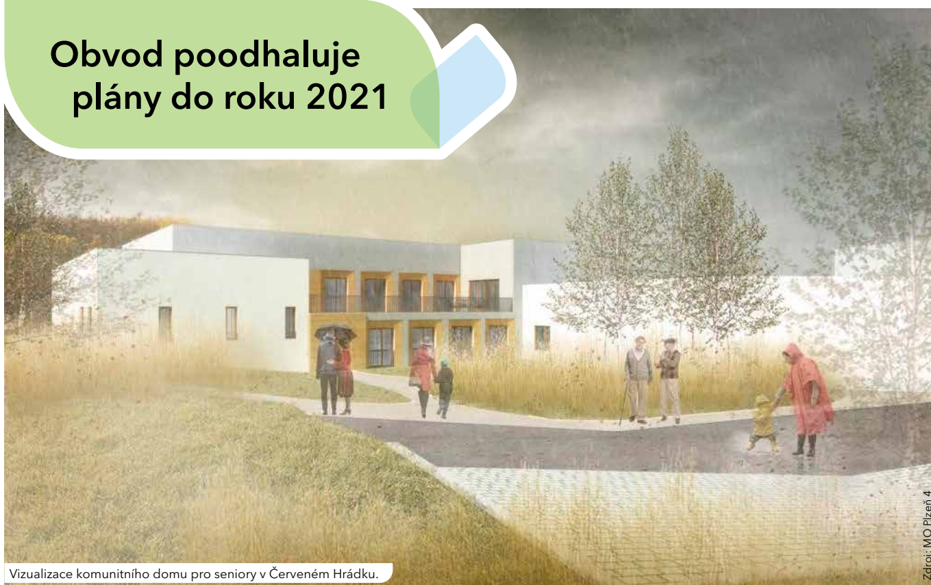
Vizualizace komunitního domu pro seniory v Červeném Hrádku.