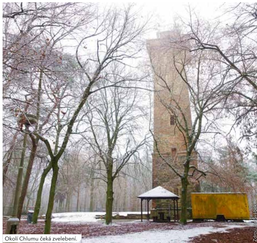
Okolí Chlumu čeká zvelebení.