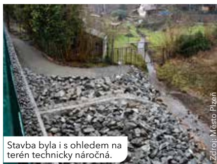
Stavba byla i s ohledem na terén technicky náročná.