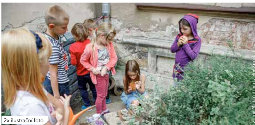
2x ilustrační foto