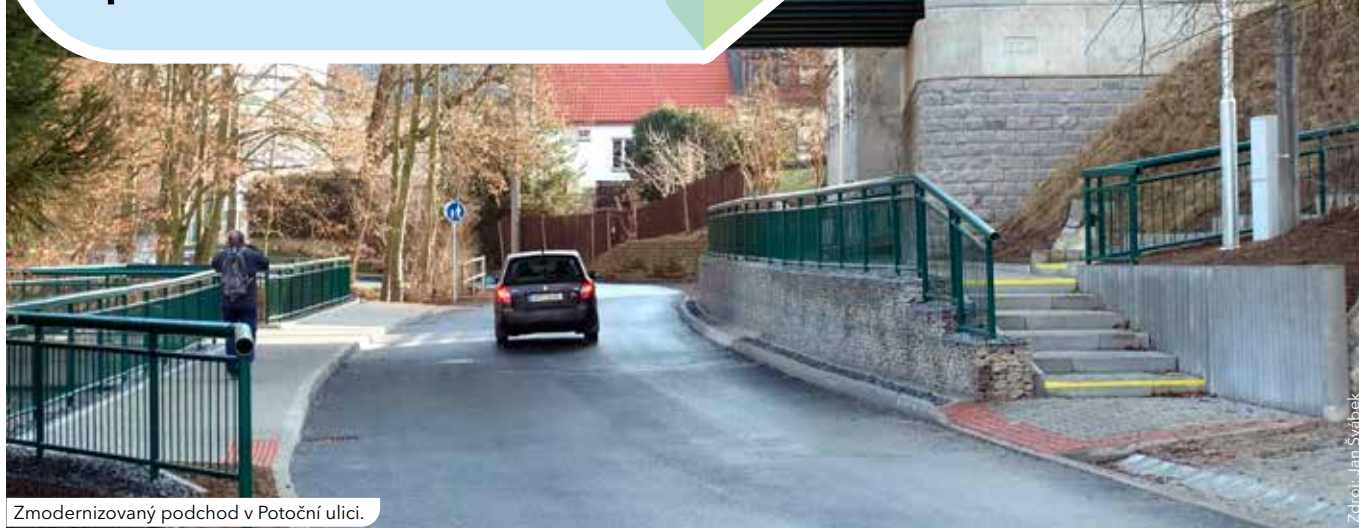
Zmodernizovaný podchod v Potoční ulici.