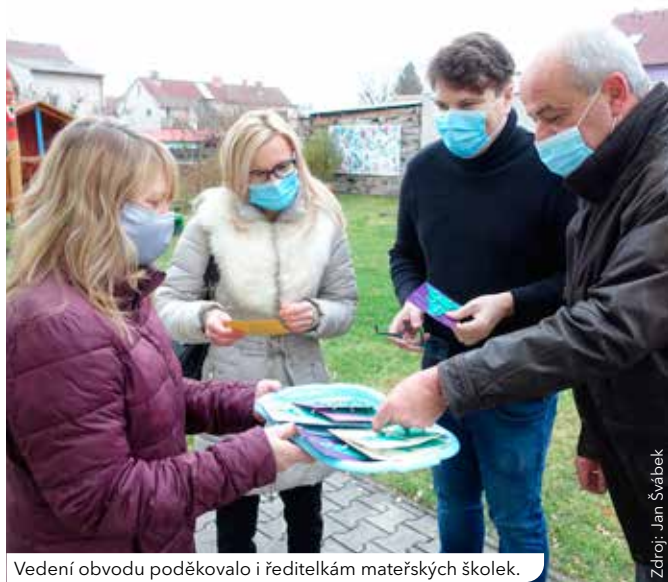
Vedení obvodu poděkovalo i ředitelkám mateřských školek.