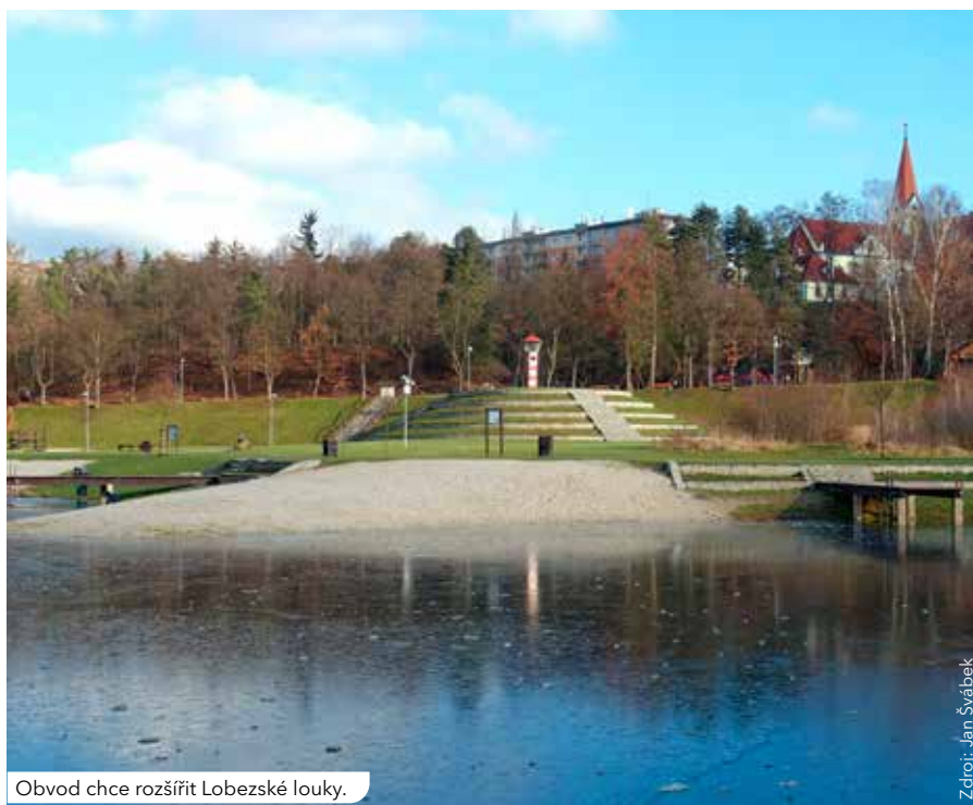
Obvod chce rozšířit Lobežské louky.

„Jednáme s SK Rapid Plzeň, který nám vyšel vstříc a nabídl nám do výpůjčky část sportovního areálu Lopatárny. Společně v tom vidíme záblesk toho, že se zde znovu začne rozvíjet sport a Lopatárna se vrátí do časů své největší slávy,“ dodává starosta.