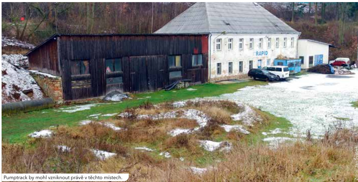
Pumptrack by mohl vzniknout právě v těchto místech.

Vyčleněny jsou také peníze na výkup pozemků – od milionu korun na rozšíření výše zmíněných Lobežských luk až po pozemky potřebné pro komunikace, chodníky a jejich odvodnění v Chlumku. Chodník v příštím roce vznikne také v místě stávajícího průšlapu v Červeném Hrádku u autobusové zastávky v Červenohrádecké ulici.