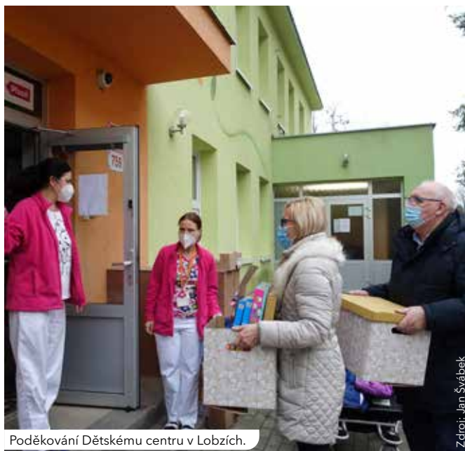
Poděkování Dětskému centru v Lobzích.