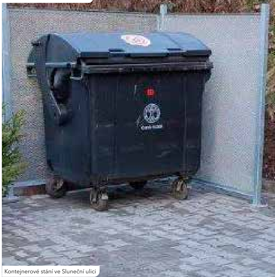
Kontejnerové stání ve Sluneční ulici