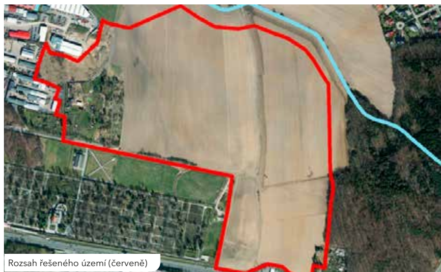
Rozsah řešeného území (červeně)

Již někdy v devadesátých letech minulého století bylo území mezi Ústředním hřbitovem, stávajícím výrobním areálem a protilehlým lesem, přiléhající na jižní straně k Rokycanské ulici a na straně druhé až ke stávajícímu zatrubněnému potoku, vymezeno jako území vhodné pro výrobu, služby a obchod. Zároveň v současné době platný Územní plán města Plzně stanovuje podmínku prověřit změny v tomto území formou územní studie, která musí být schválena v orgánech města nejpozději do 30. 9. 2020. Zpracování této studie zadal Útvar koncepce a rozvoje MMP odpovědnému projektantovi, který představil její návrh koncem loňského roku vedení a Komisi rozvoje Rady našeho obvodu pod názvem „GREEN INDUSTRY PARK“.