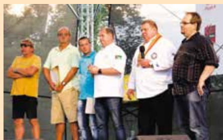
Třetí ročník festivalu se opět povedl. Organizátoři a spoluprádatelé byli spokojeni