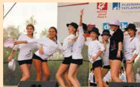
Kromě dobrého jídla tu nechyběl výborný program. Líbilo se například vystoupení taneční skupiny Storm Ballet