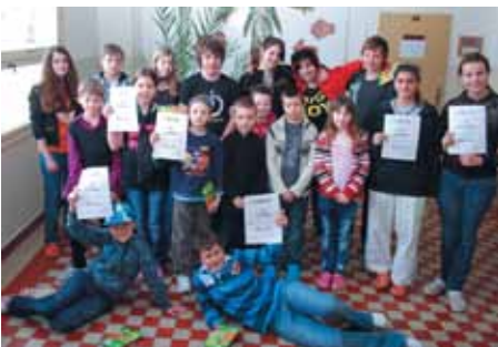
Na snímku vítězové deskových her