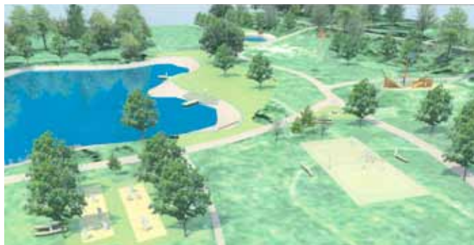
Vizualizace návrhu Plzeň - Lobzy: Povodňový park

Obyvatelé Doubravky mají šanci, že se dočkají koupaliště, které tu citelně chybí. V 90. letech bylo totiž uzavřeno koupaliště na Lopatárně. Vedení městské části plánuje pro novou moderní plovárnu využít zanedbaný městský pozemek na pravém břehu Úslavy pod Lobežským parkem. V místě, kde má vzniknout koupaliště, dříve stálo několik budov, které však zničily povodně v roce 2002. Od té doby oblast leží ladem. „Chceme využít pozemky města. Máme možnost na projekt získat dotaci, která pokryje až devadesát procent nákladů. Podle dnešních odhadů by bylo možné areál s koupalištěm vybudovat za cenu do dvaceti mili-