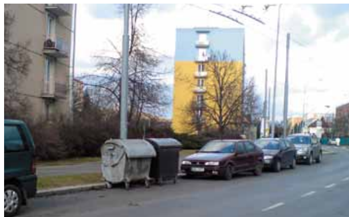
Kontejnery byly přemístěny do ulice Na Dlouhých, kde už nikomu ani ničemu nepřekáží.

Méně zřejmé je však to, že obvodní úřad nemá právo zajišťovat ani určovat místo kontejnerového stání. Takže i rozhodnutí o tom, kde budou kontejnery či popelnice stát, je na vlastníku odpadu, tedy v tomto případě na Společenství vlastníků bytů. Svozová firma podle smlouvy vyvází jen nádoby, ale nemá povinnost kolem kontejnerů uklízet nepořádek. Takovou povinnost ostatně nemá ani odbor životního prostředí ÚMO Plzeň 4. „Samozřejmě jsme už na tomto místě několikrát