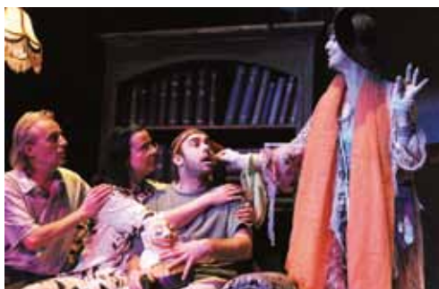
Záběr jedné z inscenací v Divadle Alfa

Pohled na známou látku optikou teena- gera je organickým pokračováním jedné repertoárové linie Divadla ALFA, určené právě „-náctiletým“.