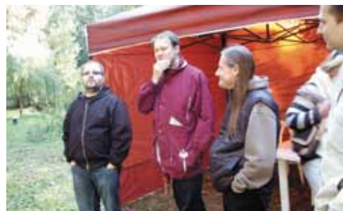
Na snímku starosta Michal Chalupný (vlevo)