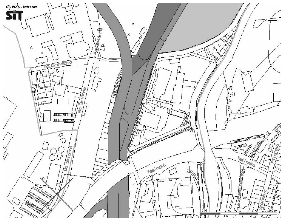
Schéma veřejně prospěšné dopravní stavby tak, jak je zaznamenána v geografickém portálu města Plzně. Lokalita mezi pražskou drahou a Doubraveckou ulicí projde zásadní změnou. Předpokládá se zbourání domů v Duchcovské ulici. GIS