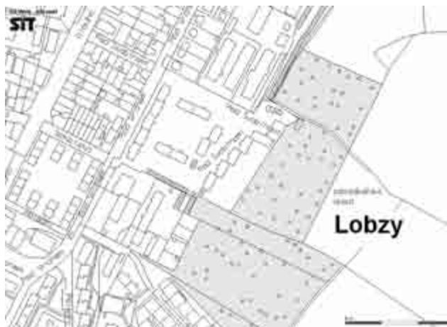
Zahrádkářská oblast v Lobzích je souvislým pásem na území MO Plzeň 4, táhnoucím se od ulice Pod Švabinami po ulici Sluneční.