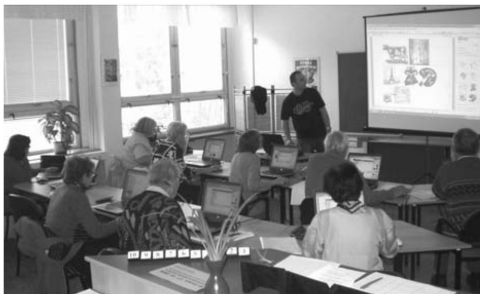
V pavilonu 28. ZŠ vybudovalo o. s. TOTEM velmi příjemné prostředí s moderní mobilní PC učebnou. Probíhá zde např. nový projekt „Školička internetu pro seniory.“