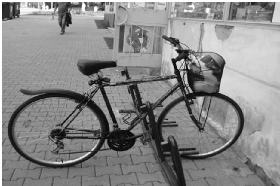
19 nových stojanů na kola jsme umístili na vytipovaných místech na obvodě.